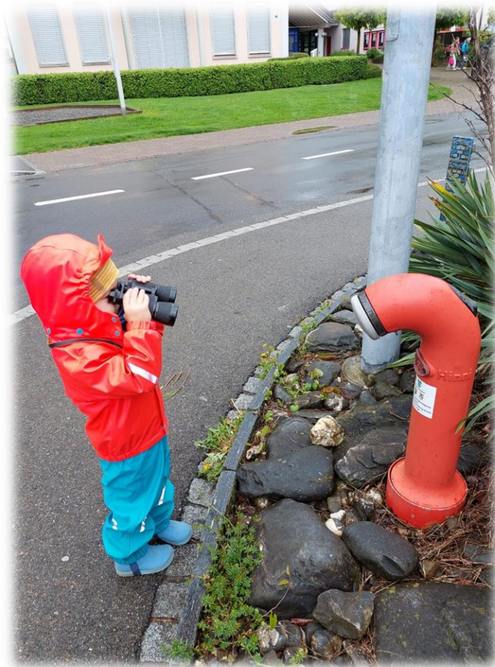
Nachwuchs

Bürgerversammlung vom Freitag, 04. April 2025