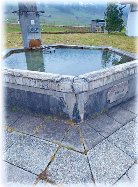
Sanierungsbedürftiger Dorfbrunnen beim Schulhaus Rufi