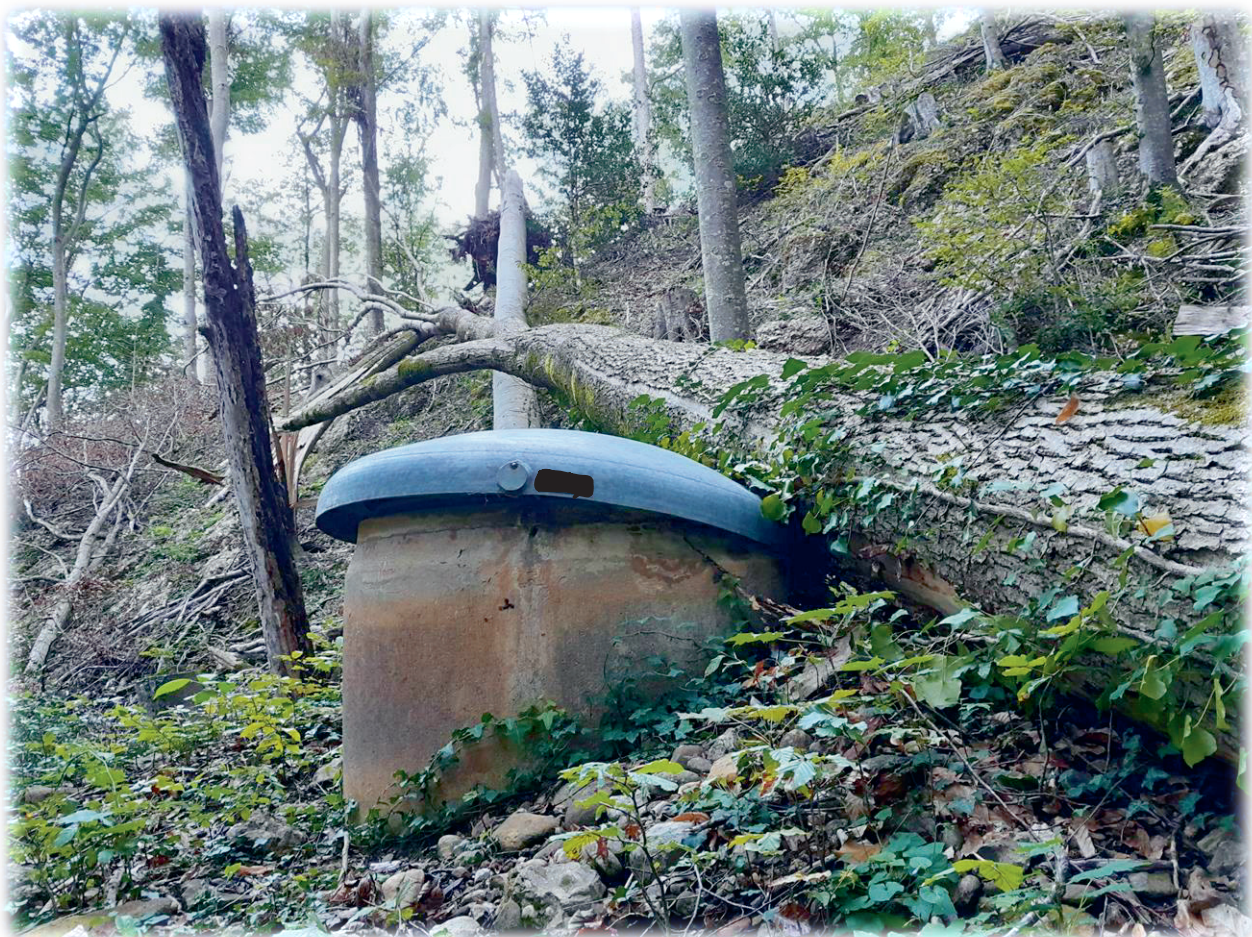
Quellschacht-Deckel nach Baumsturz