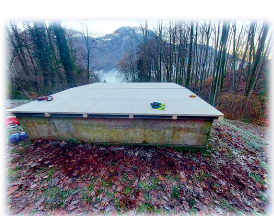
Dachreparatur Reservoir Geissrüti, vorher / nachher