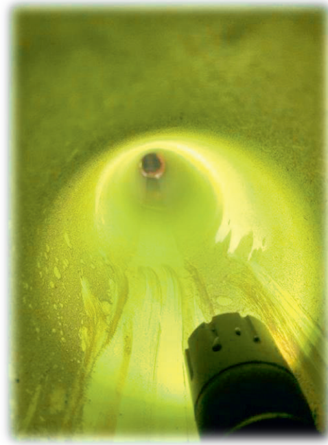
Filmen einer Leitung