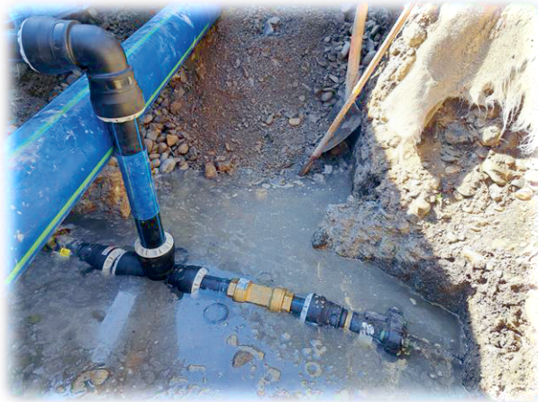
Quellenstrasse: Abgang Hydrant mit Hausanschluss